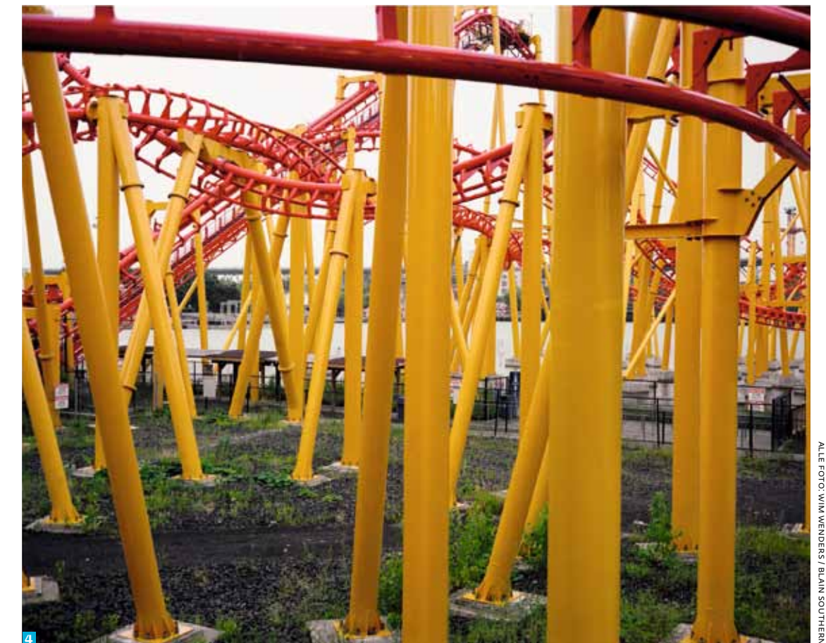
ALE FOTO: WIM WENDERS / BLAIN SOUTHERN