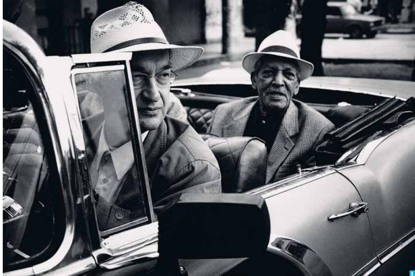
1 SJÅFØR. Wim Wenders under innspillingen av «Buena Vista Social Club». Nå skal han lage oppfølgeren. 2 FILMBALLETT. «Pina» var en hyllest i 3D til den tyske danseren og koreografen.