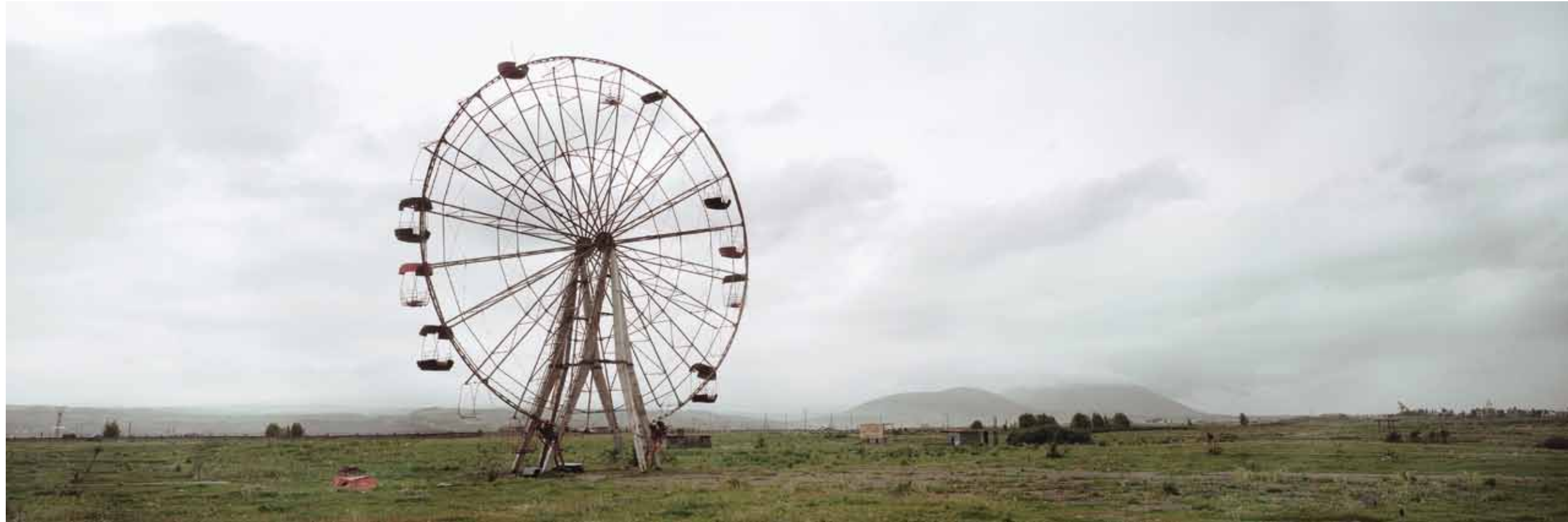
1 ØDE LANDSKAP. – Fotograferingen er det eneste som roer meg, sier Wim Wenders. Her et pariserhjul i Armenia, 2008. 2 STILLE. Gatehjørne i Butte, Montana, 2003. 3 TIDLØST. To biler og en kvinne som venter, Houston, Texas i 1983. 4 SPOR. Berg-og-dal-bane i Montréal, Canada, 2013, fra hans nåværende utstilling «Time Capsules. By the side of the road» på galleriet Blain Southern i Berlin.