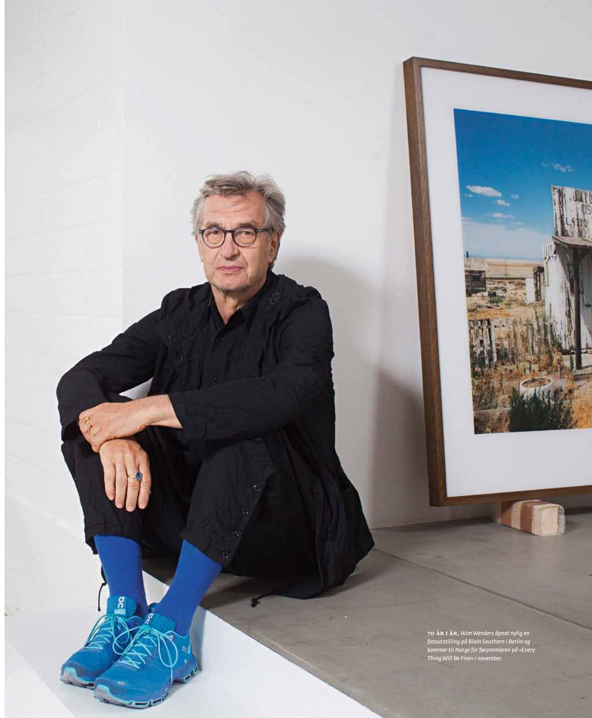
70 ÅR I ÅR. Wim Wenders åpnet nylig en fotoutstilling på Blain Southern i Berlin og kommer til Norge for førpremier på «Every Thing Will Be Fine» i november.

Filmskaperen mener at akkurat dette var veldig uvanlig for det amerikanske publikum på den tiden. »