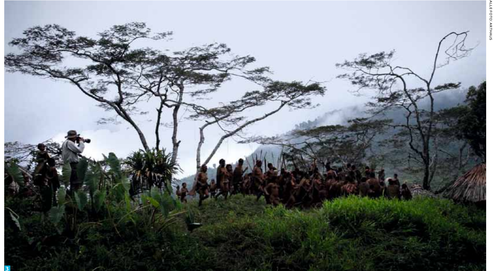
3 LIKESINNET. Wenders fulgte en annen rastløs sjel i «The Salt of The Earth» – fotografen Sebastião Salgado.

DEN SOM LEVER I ET SAMFUNN FULLT AV REGLER, VET AT HAN HAR EN OUTSIDER INNI SEG, MEN ER IKKE SÅ MYE I KONTAKT MED HAM. OUTSIDEREN ER DEFINITIVT DEN MEST INTERESSANTE, HAN ER PÅ MANGE MÅTER EN METAFOR FOR HVEM VI EGENLIG ER